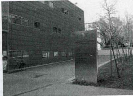
Une partie de la façade de la faculté de sciences économique et de gestion

En septembre, chaque étudiant présente son travail devant un jury dans le lequel siège le maître de stage et l'enseignant-tuteur.