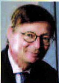
Dominique LIGER, directeur général de la caisse nationale du RSI