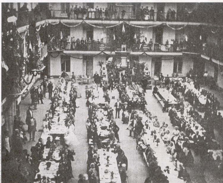
Fête du travail, fin du XIX e siècle, cour du pavillon central.

(3) Notamment député de l'Aisne de 1871 à 1876.