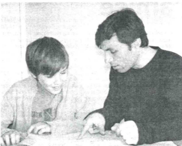
Garde d'enfants, soutien scolaire, aide aux personnes âgées... Tout au long de la vie l'économie sociale intervient dans les services à la personne.

L'historien retracera en particulier l'évolution de ces métiers depuis 1945, avec le rôle de la Sécurité sociale et de tous les organismes qui vont s'occuper d'accompagnement des personnes, de prévention, d'éducation à la santé. Notamment les associations familiales qui seront pionnières pour l'aide à domicile. Enfin, Jean-Luc Souchet abordera la fin des 30 glorieuses et " le monde qui bascule sous le poids de la financiarisation. " " On voit bien que du côté des entreprises à but lucratif, l'intérêt est d'investir ces services à la personne comme un nouveau champ lucratif, en créant une fracture entre ceux qui, soit auront pu prendre des garanties assurantielles suffisantes, soit auront des moyens financiers personnels, et ceux qui ne pourront pas payer ces services et seront exclus ou renvoyés à l'assistante publique. Dès lors, l'intervention de l'économie sociale devient, paradoxalement,